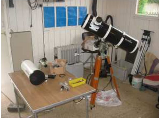
Didier Defrançois installe une platine supplémentaire pour supporter la Lunt sur la monture Valmecca