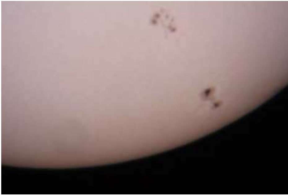
(afocal hyperion 5mm astrosolar canon 1000D)