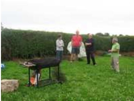
Préparation du barbecue.....