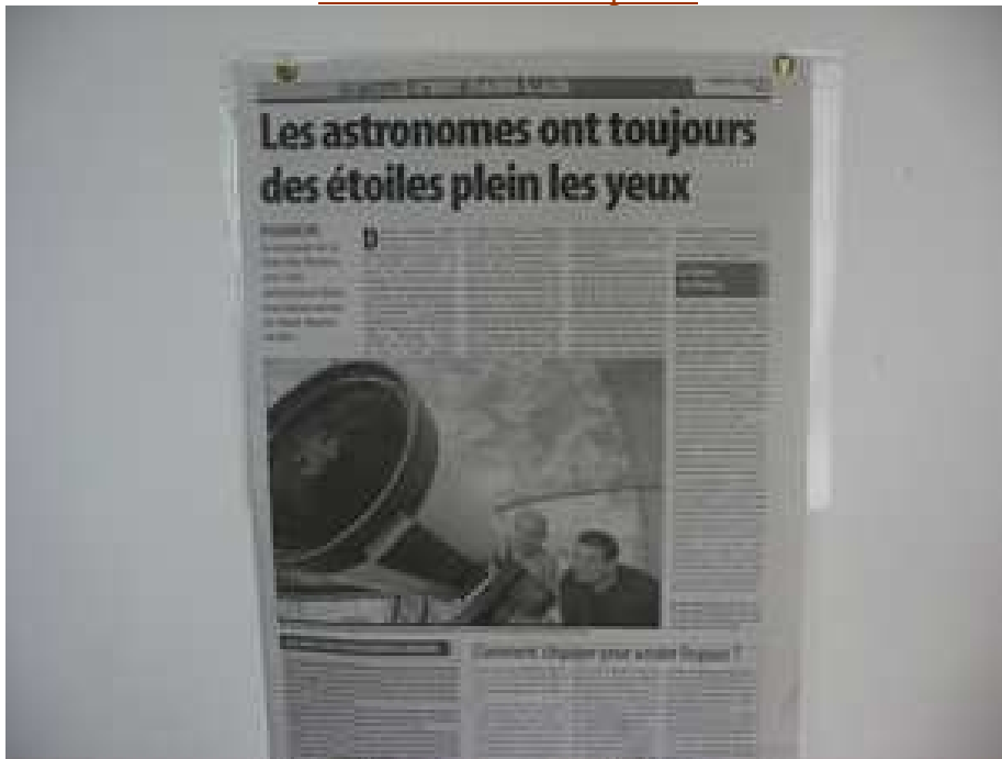
Photo de l'article de presse

Est-il vraiment indispensable de demander une subvention pour un instrument plus performant ? celui-ci fait au moins 2m de long !!!!