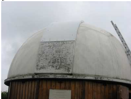
Le cimier de la coupole a été partiellement repeint