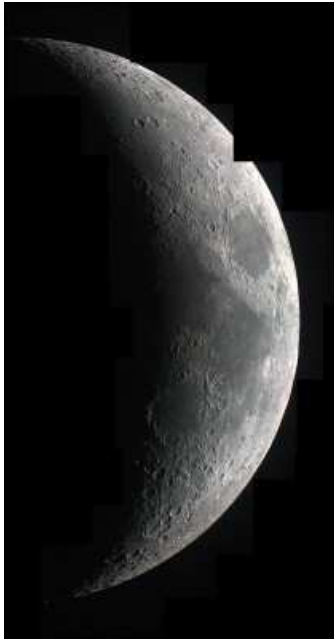
Cherchez l'anomalie ?