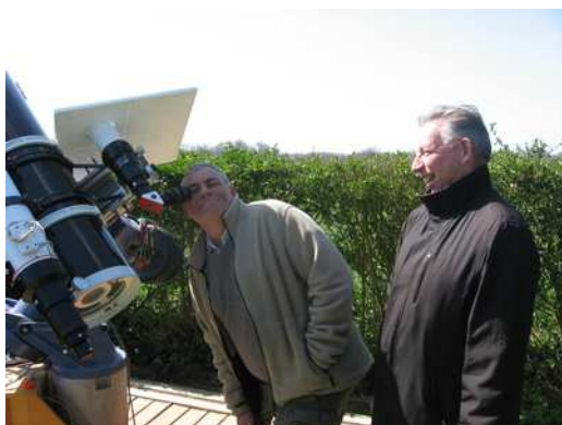
OBSERVATION DU SOLEIL A LA LUNETTE