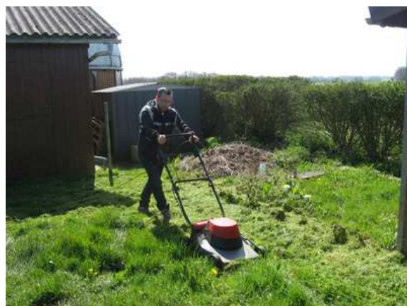
DES MEMBRES COURAGEUX COMMENCENT LA CORVEE DE TONTE !!