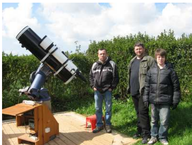
Observation du Soleil à la Lunt

PETITE INFORMATION : LE BARBECUE AURA LIEU LE DIMANCHE 2 JUIN 2013 Bien entendu, vous allez recevoir une invitation prochainement !