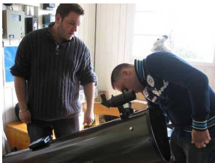
Un visiteur assidu venu avec son instrument.