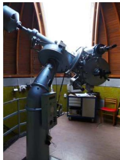
Observatoire de Prague