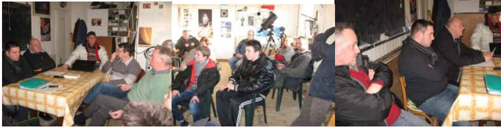
Tableau de mission pouvant évoluer qui se trouvera sur le forum du site

Suite à l'AG, Il est décidé l'achat d'une Lunette ED 120 qui devra être accompagné de l'achat d'un réducteur de focale pour permettre d'avoir un champ de vision plus important. La séance est levée à 17h30.