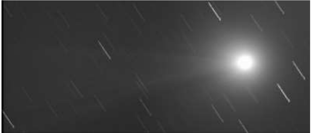
Comète Lovejoy