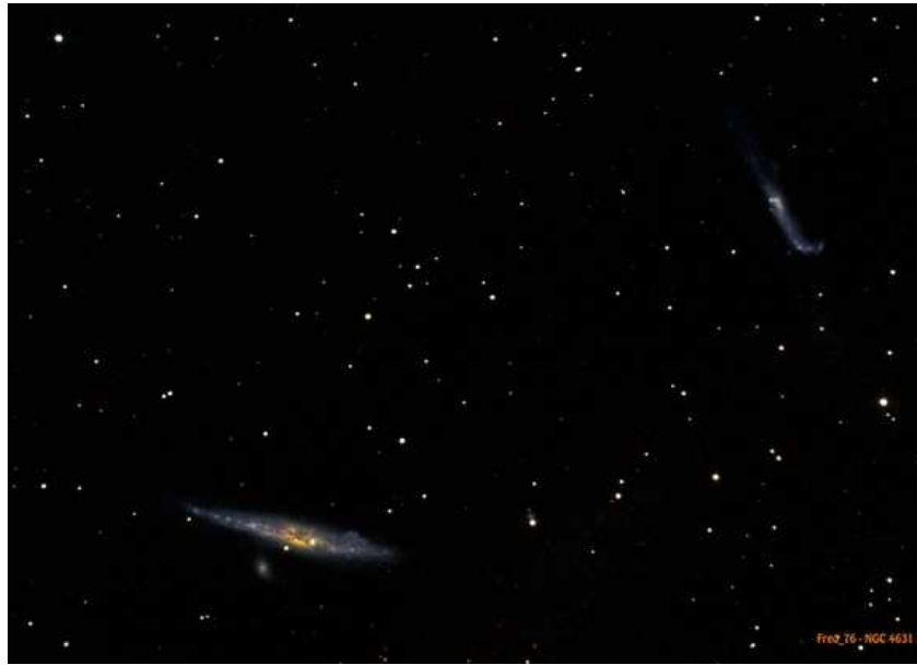
NGC 4631 (La Baleine) et NGC 4656 (La Crosse)

Un peu de soleil pour nous réchauffer !