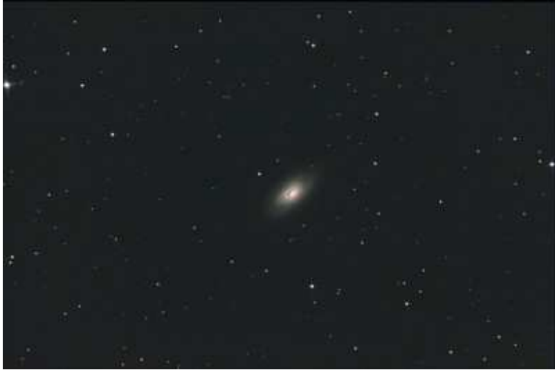
M 64