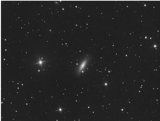
M 102