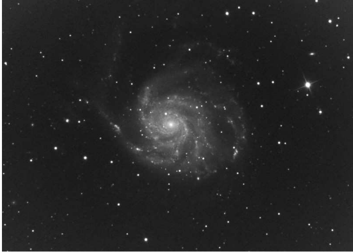
M 63