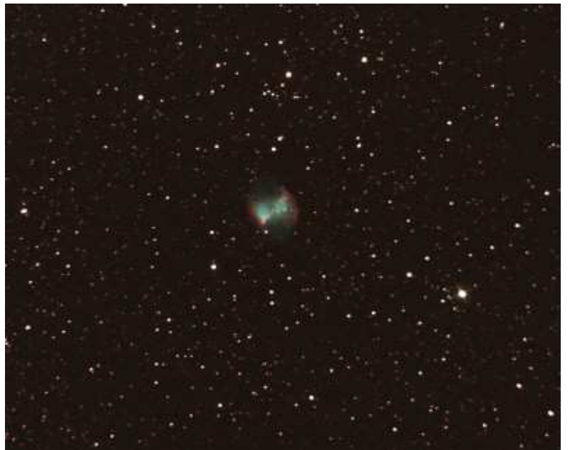
M 27