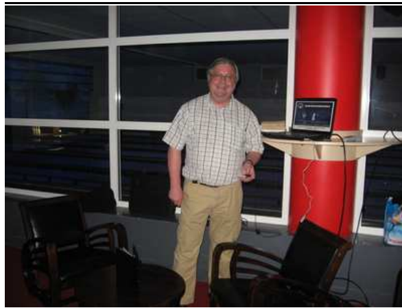
Notre aimable conférencier !